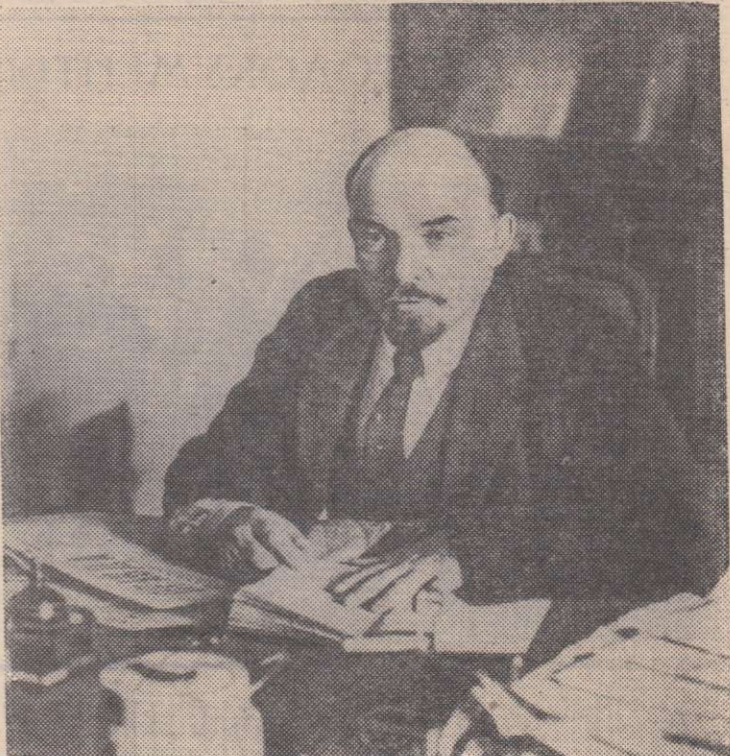
В. И. Ленин в своем кабинете в Кремле. Москва, октябрь 1918 года.

Лишь разумный подход к определению оптимальных сроков сева позволит в каждом колхозе и совхозе, на каждом отдельном поле получить высокий урожай сельскохозяйственных культур.